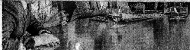
CAMILO E LULA se reuniram ontem em Brasília

de que haveria a suspensão do cronograma da reforma e nem de que foi adiada a adaptação do Enem.