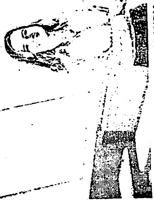
PI ALINDIA Laito de Mito, frou