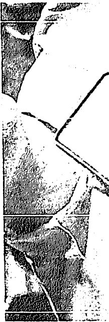
WAGNER participou ontem de evento com empresários do setor automotivo em Fortaleza

falando do padrinho do outro", mas que está "focado em propostas e no cenário".