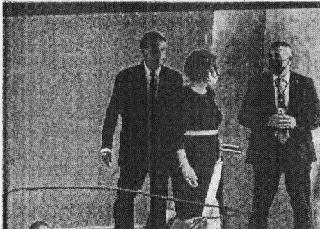
BOLSONARO ao chegar para discursar na Assembleia Geral da ONU, em Nova York