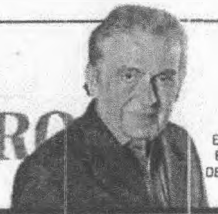
ESTA COLUNA É PUBLICADA DE SEGUNDA A DOMINGO

A Reitoria da Universidade Federal será acionada hoje, em torno do bicentenário da Independência do Brasil.