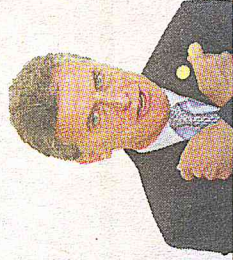
Macri, à esquerda, e Cartes, à direita, em reunião em Buenos Aires.

REUNIÃO. Os presidentes argentino, Mauricio Macri, e paraguaio, Horácio Cartes, se reuniram em Buenos Aires para tratar do Mercosul e da luta ao narcotráfico