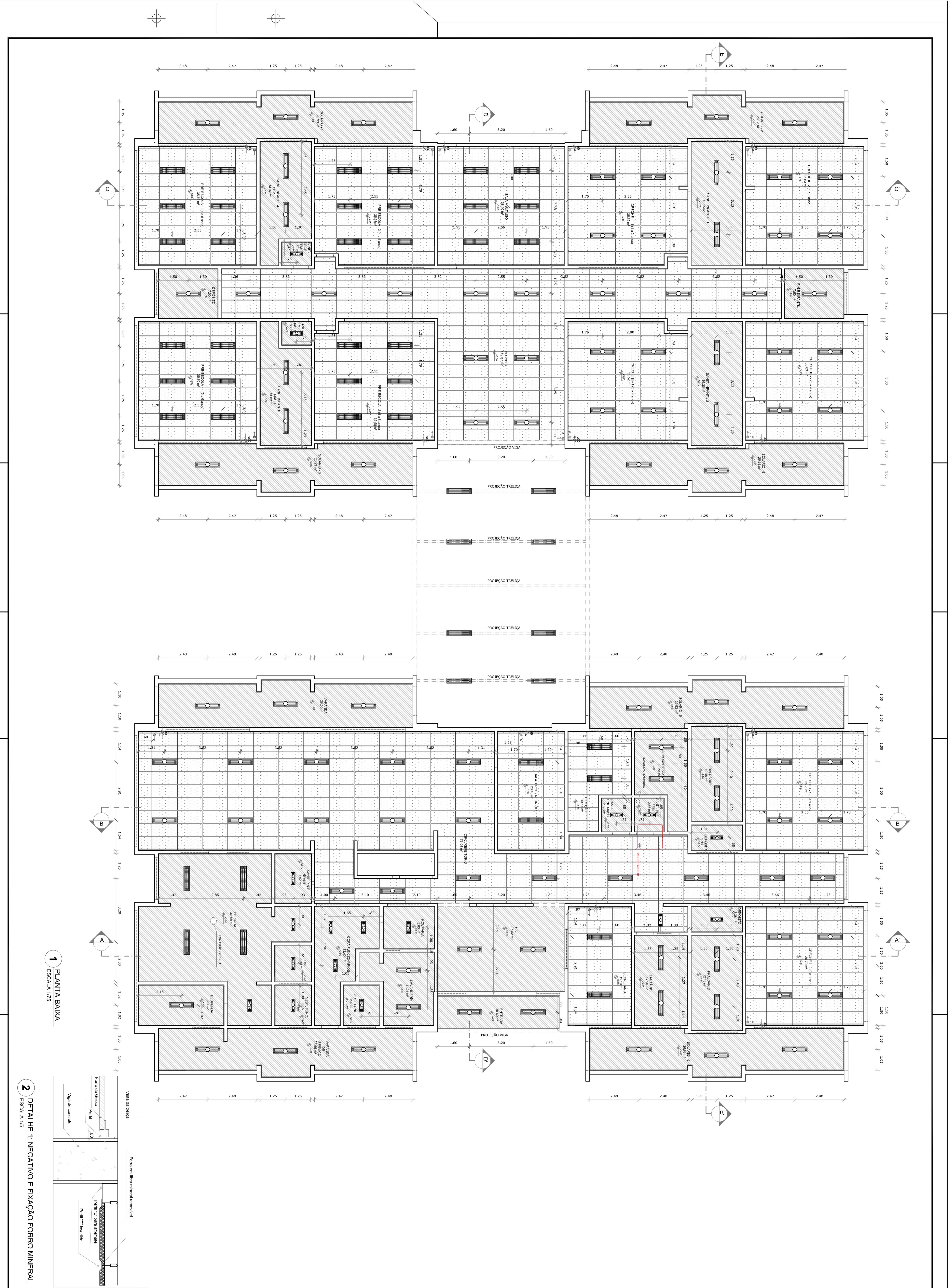
1 PLANTA BAIXA ESCALA 1/75